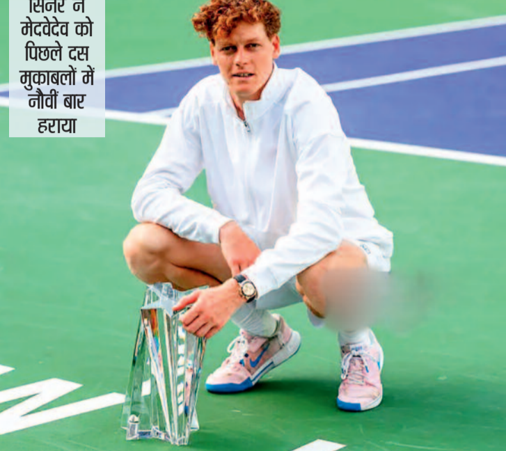
मैंने लगातार विश्वास बनाए रखा : सिनर मैच के बाद सिनर ने कहा, मैं लगातार विश्वास बनाए रखता रहा और अपने शॉट्स खेलने की कोशिश करता रहा। अगर तीसरा सेट होता तो मुकाबला बराबरी से शुरू होता, इसलिए मैंने मैच खत्म करने की पूरी कोशिश की और इस जीत से बेहद खुश हूँ।

इस जीत के साथ सिनर इतिहास में ऐसे तीसरे खिलाड़ी बन गए हैं, जिन्होंने सभी छह एटीपी मास्टर्स 1000 हार्ड-कोर्ट खिताब जीते हैं। इस उपलब्धि के साथ वह टेनिस के दिग्गज नोवाक जोकोविच और रोजर फेडरर के विशेष वलब में शामिल हो गए। साल का यह उनका पहला खिताब है। इसके साथ ही वह 1990 के बाद पहले खिलाड़ी बन गए हैं, जिन्होंने लगातार दो मास्टर्स 1000 खिताब बिना एक भी सेट गंवाए जीते हैं। पेरिस में पिछले वर्ष जीते खिताब से शुरू हुई उनकी जीत की लय इस श्रेणी में 11 मैचों तक पहुंच गई है।