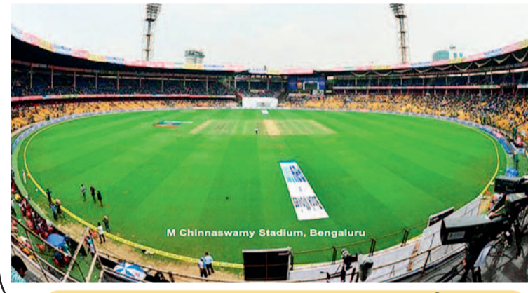
चिन्नास्वामी स्टेडियम में होंगे आईपीएल मैच