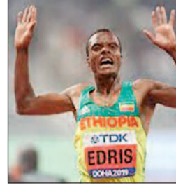
बोनस धनराशि भी मिलेगी। पुरुष वर्ग में किबेट पर सबकी नजर रहेगी। इस 20 वर्षीय खिलाड़ी ने दो साल पहले विश्व जूनियर एथलेटिक्स चैंपियनशिप के फाइनल में जगह बनाई थी। किबेट उन पांच एथलीटों में से एक हैं, जिन्होंने इस साल 27 मिनट से कम समय में 10 किमी की दौड़ पूरी की है। इस प्रतियोगिता में 5000 मीटर में दो बार के विश्व चैंपियन एड्रिस भी अपनी कड़ी चुनौती पेश करेंगे।

बेंगलुरु। युगांडा के हार्बर्ट किबेट और इथियोपिया के 5000 मीटर में दो बार के विश्व चैंपियन मुख्तार एड्रिस 26 अप्रैल को होने वाली टीसीएस वर्ल्ड 10के (10 किमी) बेंगलुरु प्रतियोगिता के मुख्य आकर्षण होंगे। इस प्रतियोगिता को विश्व एथलेटिक्स से गोल्ड लेवल का दर्जा हासिल है। इसकी कुल पुरस्कार राशि 210000 अमेरिकी डॉलर है। इसमें पुरुष और महिला वर्ग में विजेता रहने वाले खिलाड़ी को 26000 अमेरिकी डॉलर के अलावा कार्स रिकॉर्ड बनाने पर बोनस धनराशि भी मिलेगी। पुरुष वर्ग में किबेट पर सबकी नजर रहेगी। इस 20 वर्षीय खिलाड़ी ने दो साल पहले विश्व जूनियर एथलेटिक्स चैंपियनशिप के फाइनल में जगह बनाई थी। किबेट उन पांच एथलीटों में से एक हैं, जिन्होंने इस साल 27 मिनट से कम समय में 10 किमी की दौड़ पूरी की है। इस प्रतियोगिता में 5000 मीटर में दो बार के विश्व चैंपियन एड्रिस भी अपनी कड़ी चुनौती पेश करेंगे।