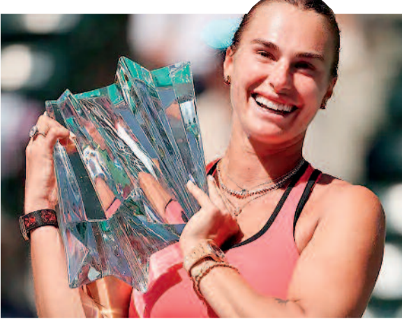
सबालेंका ने रोमांचक मुकाबले में जीता मैच

इंडियन वेल्स। यांकि सिनर ने दूसरे सेट के टाइब्रेकर में लगातार सात अंक बनाकर पिछड़े के बाद वापसी करते हुए दानिल मेदवेदेव को 7-6, 7-6 से हराकर पहली बार एक भी सेट गंवाए बिना इंडियन वेल्स खिताब जीता। दुनिया के दूसरे नंबर के खिलाड़ी सिनर ने मेदवेदेव को पिछले दस मुकाबलों में नौवीं बार हराया। मेदवेदेव ने सेमीफाइनल में शीर्ष वरीयता प्राप्त कार्लोस अल्काराज को मात दी थी। वहीं महिला वर्ग में दुनिया की नंबर एक खिलाड़ी एरिना सबालेंका ने एलेना रिबाकिनो को 3-6, 6-3, 7-6 से हराकर खिताब जीता। इससे पहले 2023 और 2025 में उपविजेता रही सबालेंका का यह पहला खिताब है।