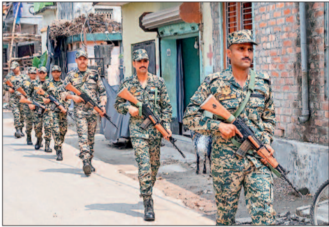
पश्चिम बंगाल में नदिया में वीएसएफ के जवान पेट्रोलिंग करते हुए।

24 घंटे के भीतर कई अफसरों के हूए तबादले, और बदले जायेंगे अफसर