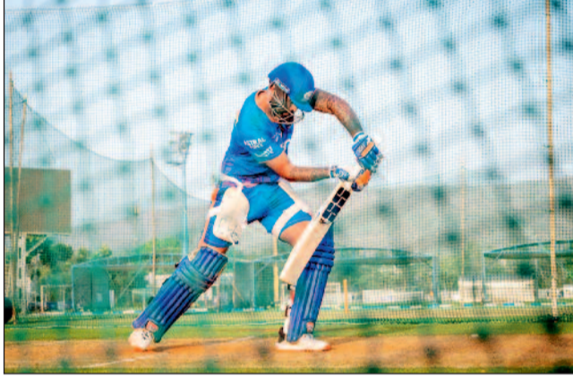
शुरुआत करना होता है। हमारे पास ऐसे लड़के हैं, जो इस फ्रेंचाइजी को बेहतर तरीके से जानते हैं। कुछ नए चेहरे भी आए हैं, पहला दिन पूरे कैंपन का माहौल तय करता है। हम चाहते थे कि हर कोई पहले सेशन से ही यह महसूस करे कि हम कैसे ट्रेनिंग करते हैं, कैसे तैयारी करते हैं, और हम एक-दूसरे के लिए कैसे पेश आते हैं।